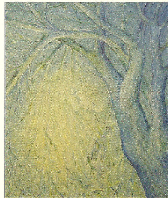
"Preghiera" - olio su tela

misteriose e malinconiche, principio di metamorfosi, latebra che offre la natura più arcana ed ancestrale insita nel bosco, evocate visioni riaffioranti dall'inconscio. E' poi pittura colta e raffinata nei trompe d'oeil, quieti, soffici e riposanti scorci di paesaggio, ancorati però al reale da solide inquadrature architettoniche. Nella minuziosa trascrizione delle nature morte dimostra una finezza d'esecuzione ed interpretazione d'altri tempi. Fluidi solchi sinuosi e modulate ondulazioni circondano plastiche figure di donna nei patinati bassorilievi in cotto, per suggerire agitati pensieri.